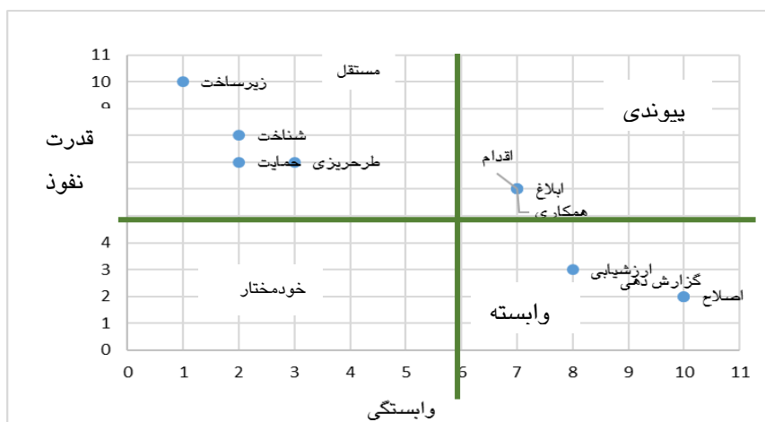
شکل ۲- گراف قدرت نفوذ و وابستگی (MICMAC)

برای تفکیک عوامل به چهار گروه مذکور، برای هر دو محور قدرت نفوذ و وابستگی، با توجه به داده های مساله آستانه ای تعریف می شود که بتواند به درستی عوامل را به چهار دسته تفکیک کند (فیروزجائیان و همکاران، ۱۳۹۲). در این تحقیق، نویسندگان میانگین به اضافه نیم را برای ترسیم خطوط تفکیک کننده، استفاده نموده اند. همانگونه که شکل فوق نشان می دهد هیچ یک از اقدامات در دسته خودمختار قرار نگرفته اند، به عبارتی همه عوامل ضروری و دارای روابط مهم با سایر اجزای سیستم هستند. زیرساخت عاملی مستقل و دارای بیشترین قدرت نفوذ است، شناخت، حمایت و طرحریزی مجدد نیز در دسته عوامل مستقل قرار دارند ولی قدرت نفوذ کمتری دارند. ابلاغ به معنی ایجاد ارتباطات سازمان یافته و هدفمند با همه ذینفعان، سپس همکاری و مشارکت با آنها در زمان اجرای فعالیتهای استقرار، در یک خوشه قرار گرفته و پیوندی هستند. به عبارتی تاثیرات عوامل مستقل را دریافت کرده، خود تاثیر می پذیرند و عوامل وابسته بعد از خود را نیز تحت تاثیر قرار می دهند. عوامل وابسته عبارتند از ارزشیابی عملکرد، اصلاح و گزارش دهی. این اقدامات تحت تاثیر سایر اقدامات پیشین هستند.